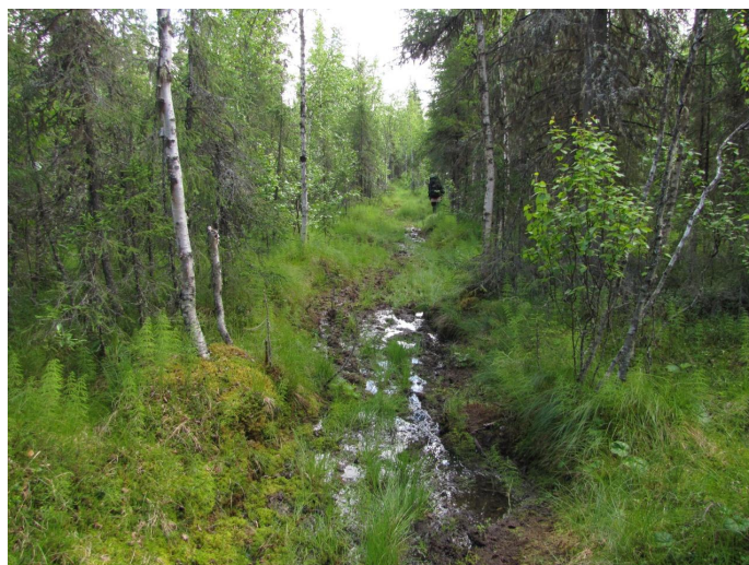
Фото 1. Участки тропы

В двух местах она пересекает небольшие осоково-сфагновые болота. Кроме того, на маршруте есть 7 небольших ручьев и два средних, шириной 5-10 м. На 20-м км тропу пересекает река Большая Ляга шириной 25-30 м. На тропе имеется четыре туристические стоянки, оборудованные навесами (фото 2-7 в приложении). На трёх стоянках имеются туалеты, на одной – изба. Две переправы через ручьи оборудованы мостиками из двух бревен с перилами (фото 8-9 в приложении). Есть переправа через ручей, состоящая из одного бревна (фото 10 в приложении). Из-за избыточного переувлажнения большая часть тропы сильно разбита. В некоторых местах глубина жидкой грязи достигает 50-60 см.