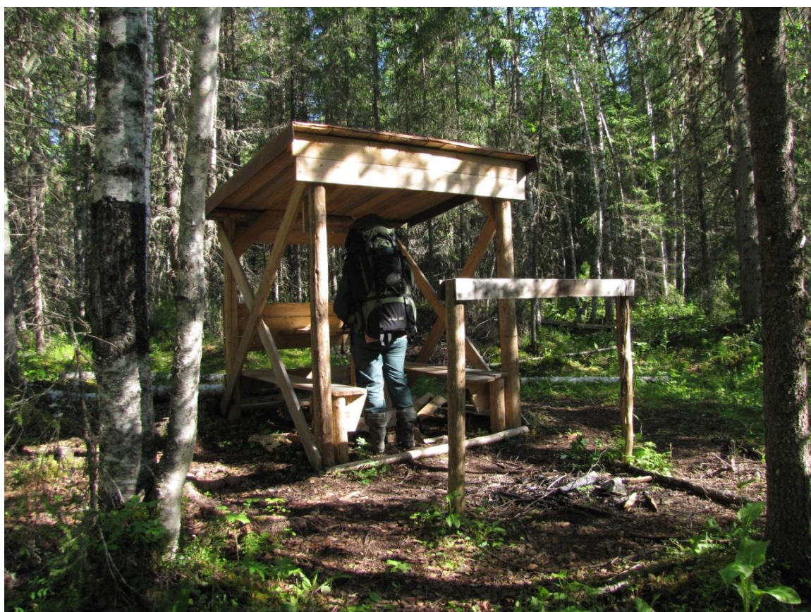
Фото 3. Стоянка для отдыха (ручей Холодный). Навес.