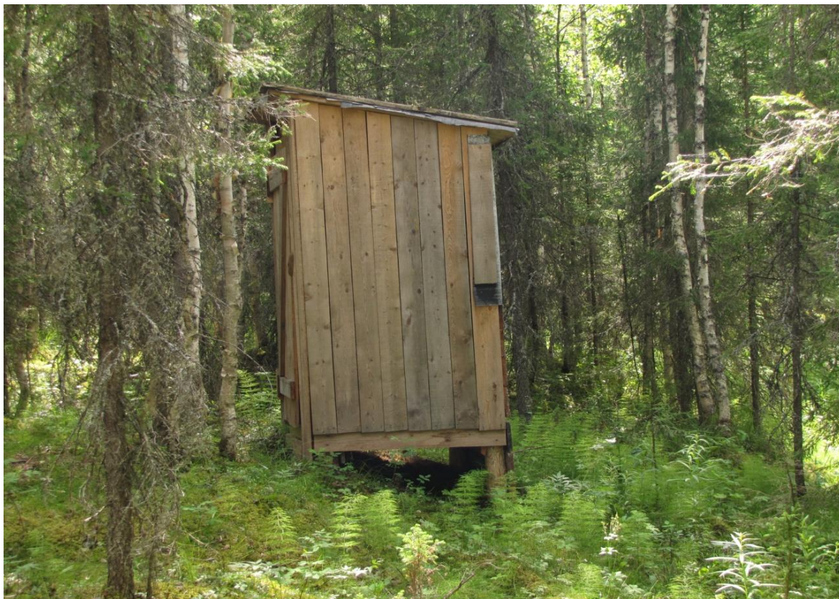
Фото 4. Туалет (ручей Холодный)