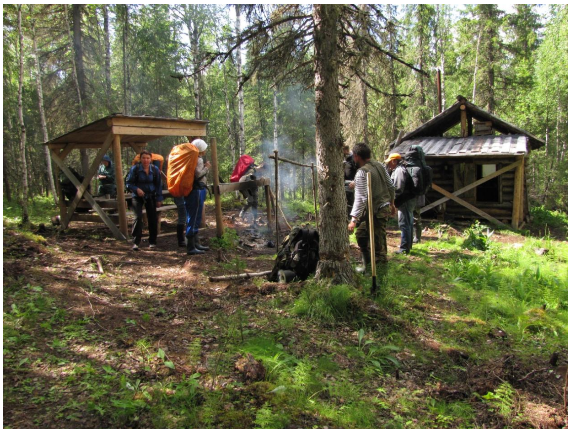
Фото 2. Стоянка для отдыха. Навес, Изба.