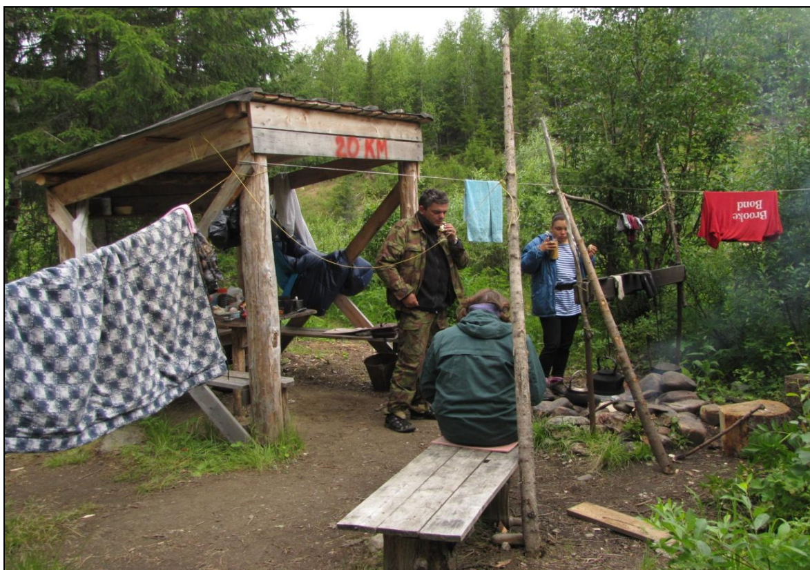
Фото 5. Стоянка на 20-м км тропы (берег р. Большая Ляга). Навес.