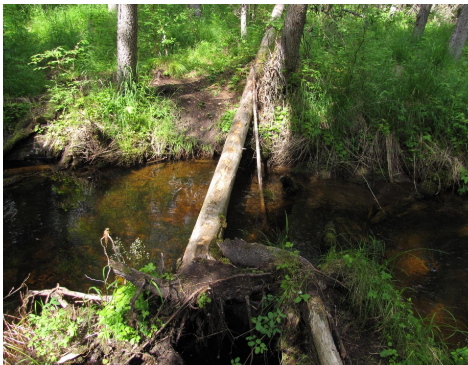
Фото 10. Переправа через ручей