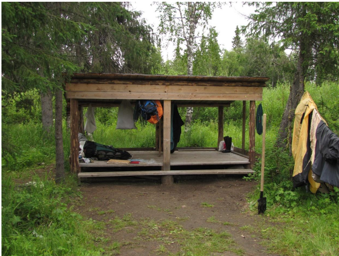
Фото 6. Стоянка на 20-м км тропы (берег р. Большая Ляга). Навес.