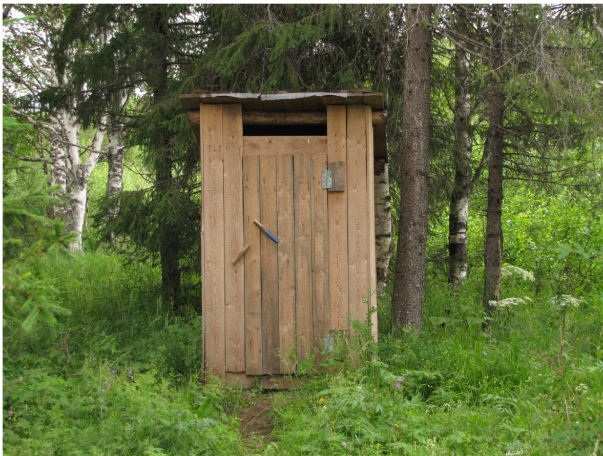
Фото 7. Стоянка на 20-м км тропы (берег р. Большая Ляга). Туалет.