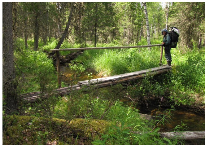
Фото 8. Мостики через ручей